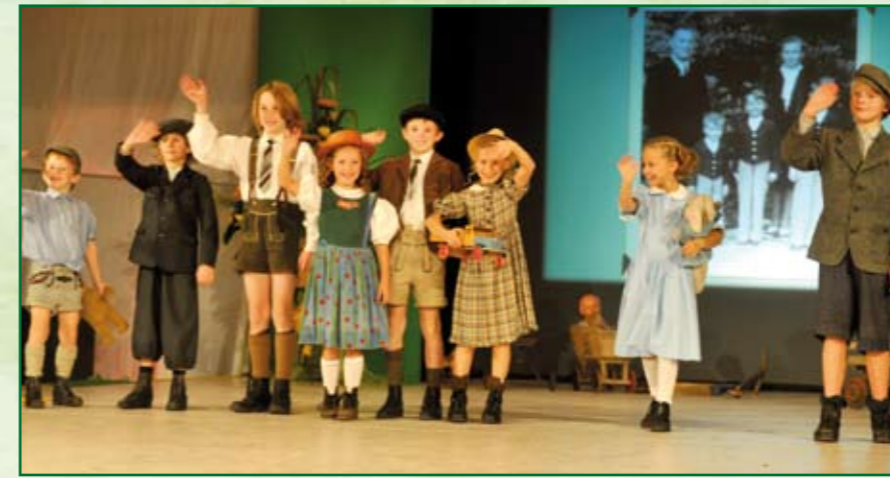
Die Ayinger Kinder-Models waren mit Feuereifer bei der Sache