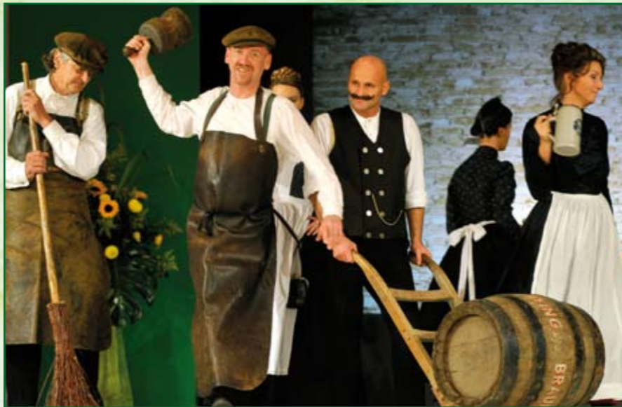
130 Jahre Brauereigeschichte in lebendigen Bildern

Der besondere gastronomische Höhepunkt des Abends war das „Schüssler-