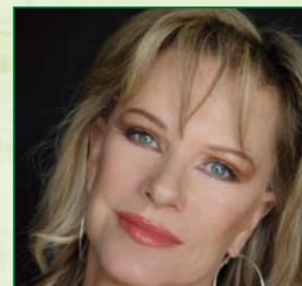
Schauspielerin und Kabarettistin Lisa Fitz