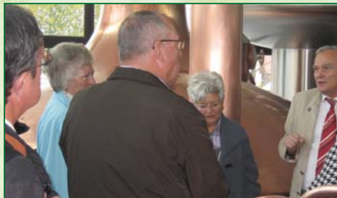
Interessante Führung bei der Weißbierbrauerei Kuchlbauer

Besuch der Malzfabrik Müller in Inkofen bei Freising