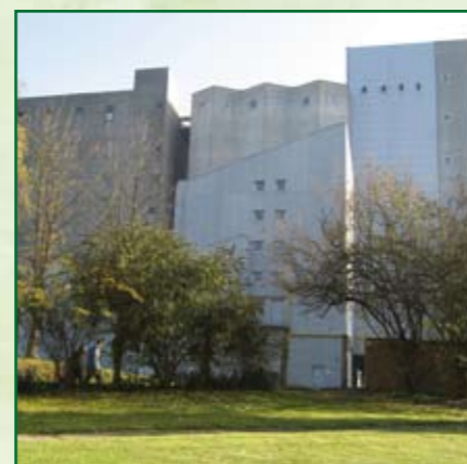
Gigantische Ausmaße: die Mälzerei Müller