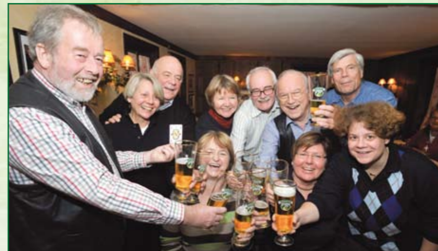
Ein zünftiger Kegelabend ist nur eine der vielfältigen Attraktionen des Freundeskreises

W er als Ayinger Biergenießer etwas auf sich hält, ist Mitglied beim Ayinger Freundeskreis! Seit Anfang 2006 existiert dieser Zusammenschluss all derer, die ihre Verbundenheit zur Marke Ayinger zum Ausdruck bringen und diese mit Gleichgesinnten teilen möchten. Unterhaltsame und informative Veranstaltungen zum Thema Bierkultur und ein regelmäßiger Stammtisch in Aying werden von den aktiven Mitgliedern gerne besucht. Viele wollen aber auch einfach nur dazu gehören und von den Vorteilen der Mitgliedschaft profitieren.